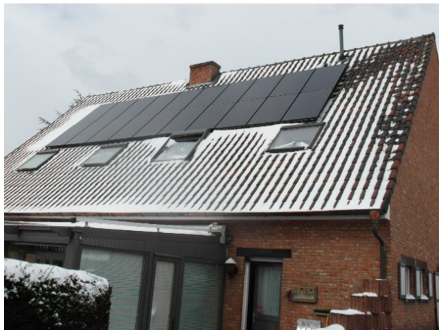
In de dezelfde straat modules Vindico gecoat

Duurzame proeven toont de hoogste levensduur van de coating op de markt aan en initieel hogere wattpiek vanwege de AR eigenschappen, maar we zien in benchmark het effect van de dubbele werking met vuilafstoting. Na een korte periode een verdubbeling van energieopbrengst vanwege minder vervuiling in vergelijking met niet gecoat. Daarnaast in gebieden waar in de winter sneeuw voorkomt blijven Vindico gecoate modules vrij van sneeuw en op een winterdag is er nog steeds opbrengst van energie;