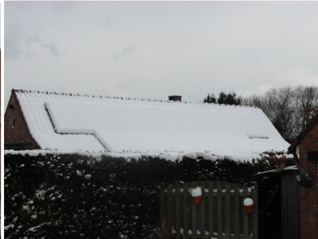
Dak buurman niet Vindico behandeld, sneeuw blijft dagen liggen